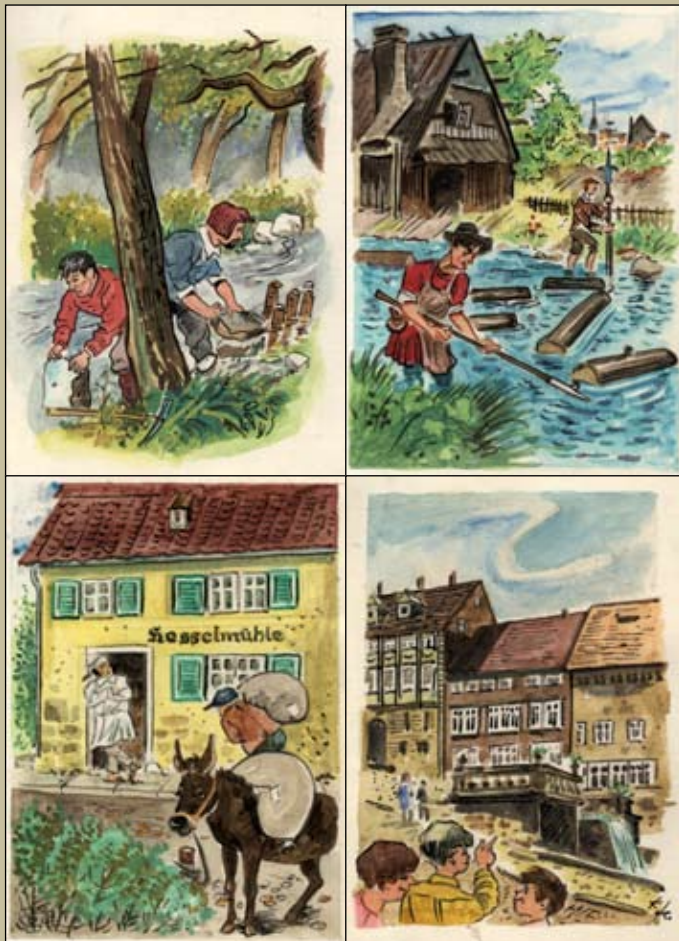
Kanalbau, Flößen, Mühle, Wasserkunst. Grafiken: Kurt Schote, 1998

Eine Lobby für den (ur)alten Schlingel! 7./8.9.2019